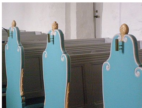
Kirkestolene i nordsiden

Meget af inventaret er ellers hentet hertil fra andre kirker. Kirkestolene er fra Budolfi kirke, Aalborg Domkirke. Læg mærke til de fine gavle med gedigent træskærerarbejde. De løgformede knopper på toppen har alle 24 forskellige mønstre. Det gælder også de smukke sideranker. Prædikestol, alter og alterbord stammer alle fra den nedlagte Buderup kirke og er kommet hertil ved den store restaurering i 1944.